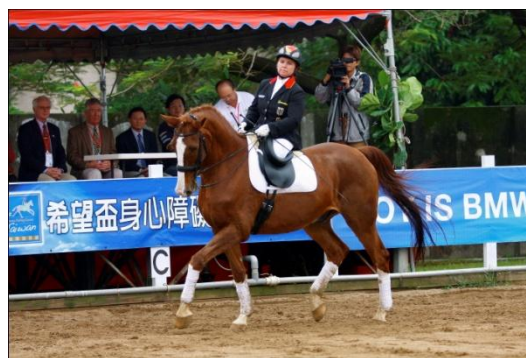
希望盃開幕典禮時的表演

不過,我們在希望盃的開幕典禮中還是得到一個表現我們能力的機會,這是令我很高興的,因為我想要讓其他的選手們知道:就算我們要借用陌生的馬匹,我們還是可以有很好的表現。但願他們能夠意識到,是他們的意志和能力將推動他們走向成功的。